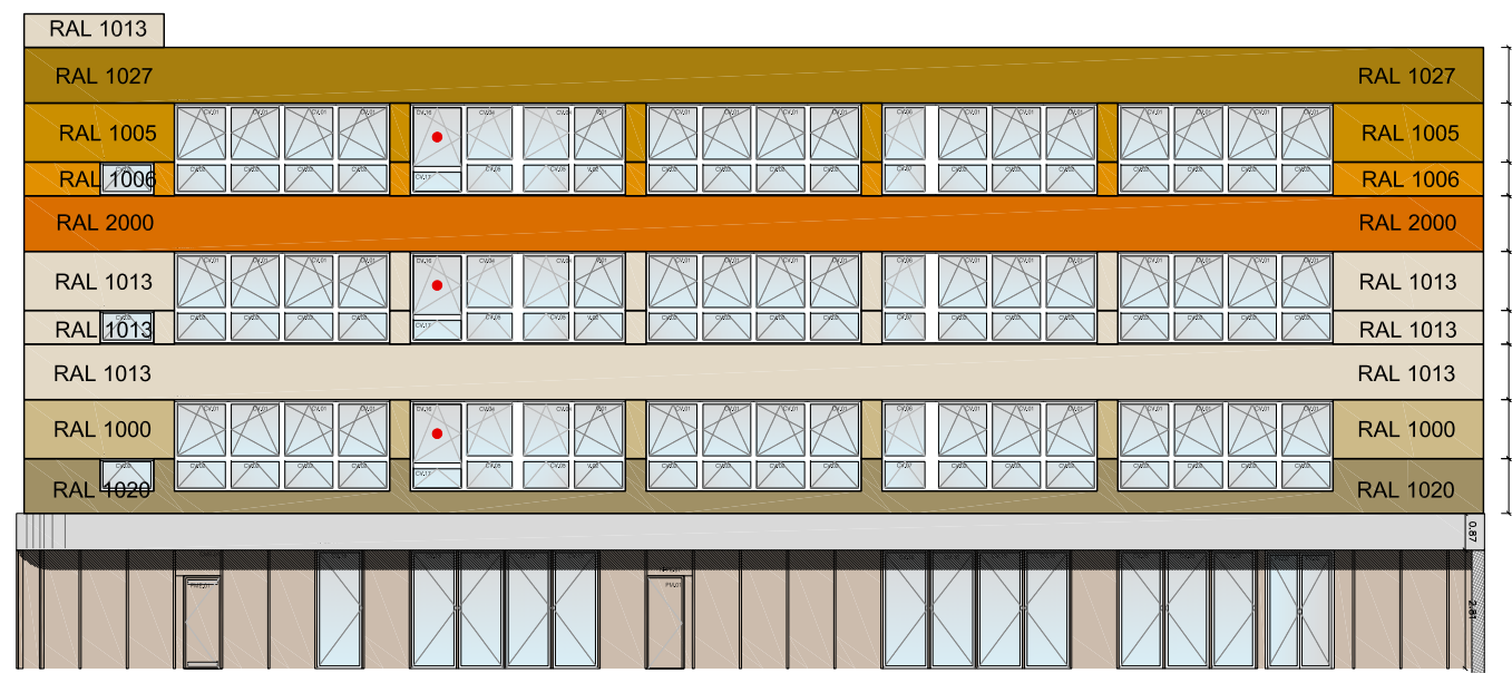
FACHADA PATIO TRASERO. ALZADO NORESTE